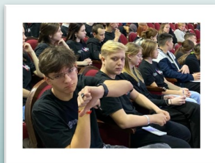
«Дружу со спортом»