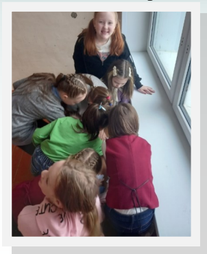
«Нет! Вредным привычкам!»